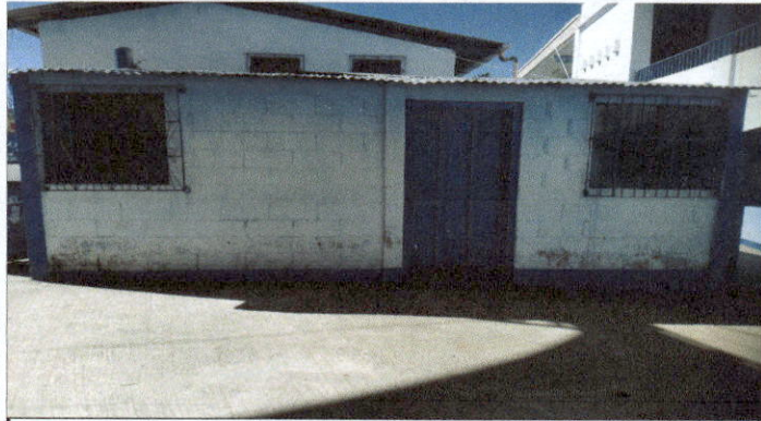
Foto1: Sustitución de Balcón de Metal